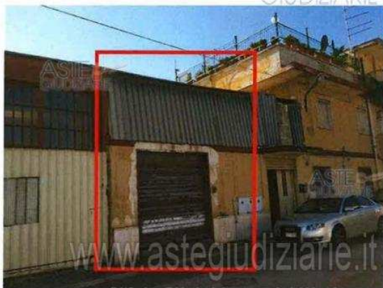
Publicazione unificata ad esclusivo uso personale - è vietata ogni ripubblicazione o riproduzione a scopo commerciale - Aut. Min. Giustizia PDG 21/07/09 Foto 4_1 (lotto 4)

Luogo Puglia, Taranto https://www.annunci.it/x-107919-z