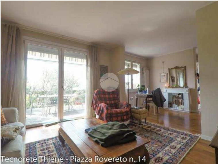
Tecnorete Thiene - Piazza Rovereto n. 14

Luogo Veneto, Zanè https://www.annunci.it/x-115726-z