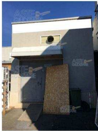
Foto 1. Vista ingresso n. 4 www.astegudiziarie.it Pubblicazione ufficiale sul sito del Tribunale di Catania - Via Salvatore Averna 4 - 95100 Catania (CT) - Tel. 095 4 333 99 - Fax 095 4 333 99 - E-mail: astegudiziarie@tiscali.it - Pagine Gialle: Tribunale di Catania - Esecuzione immobiliare post legge 80 n. 713/2022.

Luogo Sicilia, Misterbianco https://www.annunci.it/x-142204-z