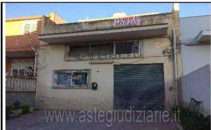
Publicazione unificata ad esclusivo uso personale - è vietata ogni riproduzione o pubblicazione a scopo commerciale - Aut. Min. Giustizia - RRG-04/07/2023 Foto n.1: Prospetto principale

IMMOBILI-IMMOBILE COMMERCIALE-C.da raganzino - viale australia 2e https://www.annunci.it/x-156645-z