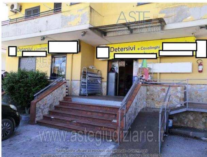
Publicazione ufficiale ad esclusivo uso personale - (art.146 c.c.p.) ripublication o riproduzione a scopo commerciale - Art. 171 n. 1 (Giustizia PD 3/21/07/23) vista esterna dell'immobile oggetto di pignoramento

IMMOBILI-IMMOBILE COMMERCIALE-Via vittorio veneto 28 https://www.annunci.it/x-156719-z