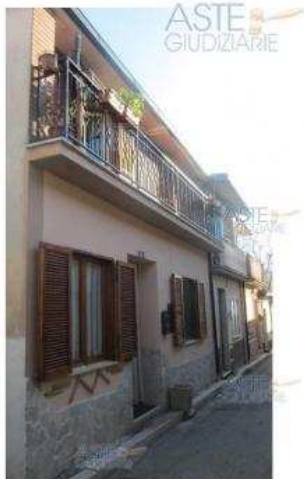
FOTO R.L. - ESTERNO, VIA DEI BENEDETTINI www.astegiudiziarie.it Publicazione ufficiale ad esclusivo uso personale - è vietata ogni riproduzione o diffusione a scopo commerciale - Aut. Min. Giustizia POS 210709

Per informazioni e richieste di vendita, si prega di contattare l'Ufficio Vendite Giudiziarie, presso il Tribunale di Avezzano, viale della Repubblica, 100, tel. 086 168 168, o via email a info@astegiudiziarie.it