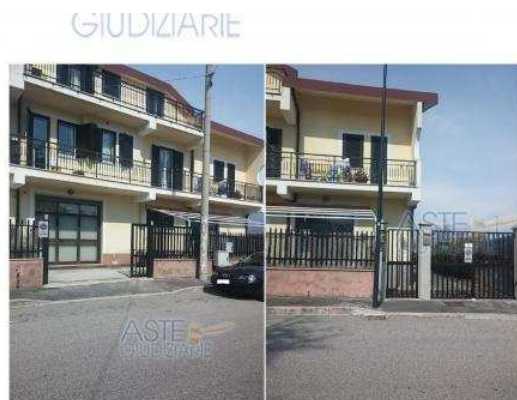
ALLEGATO 15 - Foto Esterno