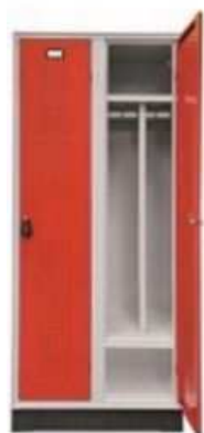
Armadio spogliatoio tradizionale: