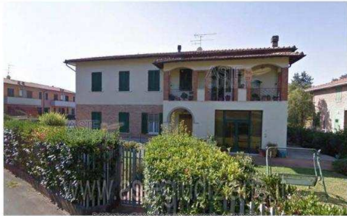
Lotto n.4 – vista esterna

Luogo Toscana, San Miniato https://www.annunci.it/x-191231-z