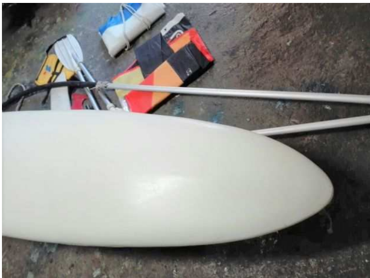
tavola completa da windsurf Olympic Surf versatile multiuso (400 EUR)

Luogo Calabria, Cosenza https://www.annunci.it/x-194612-z