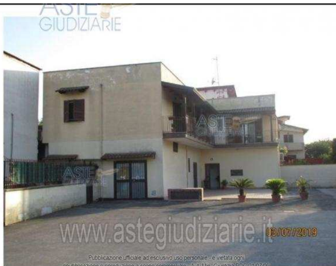
Publicazione ufficiale ad esclusivo uso personale - è vietata ogni riproduzione o riproduzione a scopo commerciale - Aut. Min. Giustizia P.064107/09 Fotografia 7 - Vista fabbrica dal cortile interno.

all'asta. I professionisti incaricati dal Tribunale (custode, delegato, curatore) sono a disposizione per fornire tutte le informazioni necessarie all'acquirente.