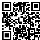
FOTO VERE. RAGAZZE TAILANDESE PER MASSAGGIO INDIMENTICABILE Tel 0009200920nunci.it/x-205287-z