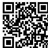
FOTO VERE. RAGAZZE TAILANDESE PER MASSAGGIO INDIMENTICABILE Tel 0009200920nunci.it/x-205287-z