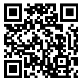
FOTO VERE. RAGAZZE TAILANDESE PER MASSAGGIO INDIMENTICABILE Tel 0009200920nunci.it/x-205287-z