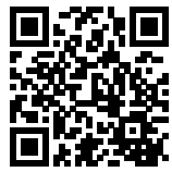
FOTO VERE. RAGAZZE TAILANDESE PER MASSAGGIO INDIMENTICABILE Tel 0009200920nunci.it/x-205287-z