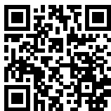
FOTO VERE. RAGAZZE TAILANDESE PER MASSAGGIO INDIMENTICABILE Tel 0009200920nunci.it/x-205287-z