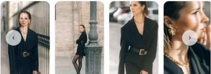
Imagen de referencia para este casting

Fotomodelle anche prima esperienze per scatti a Milano e limitrofi di genere Fashion Glamour artistico contattare via WhatsApp o email Grazie