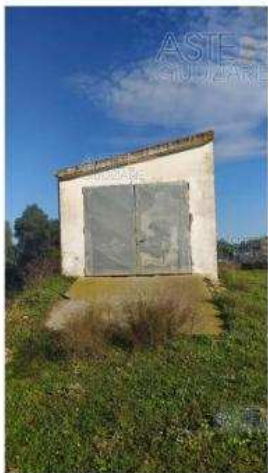
Figura n. 1 - Vista generale del fabbricato oggetto di lotto n. 1

www.astegiudiziarie.it Pubblicazione ufficiale del Tribunale di Cagliari - Esecuzione immobiliare post legge 80 n. 418/2017