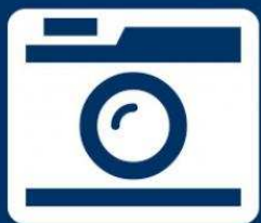
IMMAGINE NON DISPONIBILE