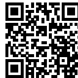
FOTO VERE.LE PIU BELLE RAGAZZE ORIENTALI PER MASSAGGIO Tel 3533280923