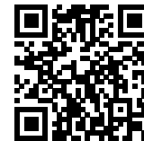
FOTO VERE.LE PIU BELLE RAGAZZE ORIENTALI PER MASSAGGIO Tel 3533280923