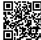
FOTO VERE.LE PIU BELLE RAGAZZE ORIENTALI PER MASSAGGIO Tel 3533280923