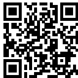
FOTO VERE.LE PIU BELLE RAGAZZE ORIENTALI PER MASSAGGIO Tel 3533280923