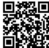
FOTO VERE.LE PIU BELLE RAGAZZE ORIENTALI PER MASSAGGIO Tel 3533280923