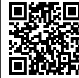
FOTO VERE.LE PIU BELLE RAGAZZE ORIENTALI PER MASSAGGIO Tel 3533280923