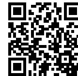
FOTO VERE.LE PIU BELLE RAGAZZE ORIENTALI PER MASSAGGIO Tel 3533280923