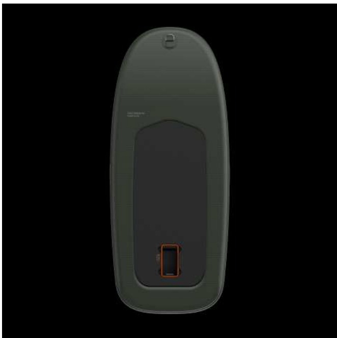
Tavola da surf Fliteboard AIR (1 EUR)

Luogo Campania, Napoli https://www.annunci.it/x-230890-z