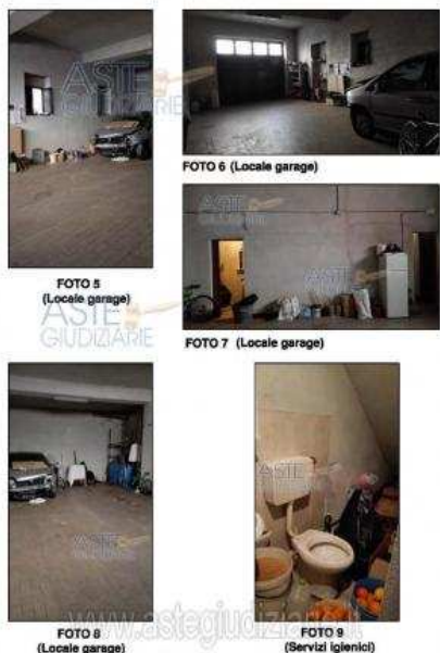
FOTO 5-9: Viste interne dell'unità immobiliare edificata e garage ubicata al piano terra in Via Fallica n. 127

Luogo Sicilia, Paternò (CT) https://www.annunci.it/x-234107-z