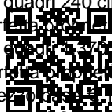
IMMAGINE MOBIL-AL IKA CATEGORIA-Via don panfilio craccacio

IMMOBILIARE CATEGORIA-Via don panfilo aracchino vendita