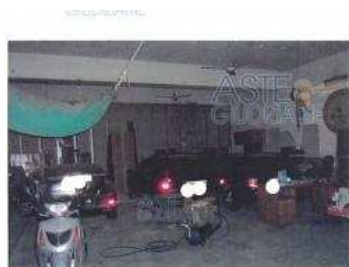
Fig. 43: Garage