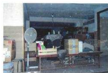
Fig. 44: Garage

www.astegiudiziarie.it Pubblicazione ufficiale del ministero della Giustizia - è vietata ogni riproduzione o riproduzione a scopo commerciale - Aut. Min. Giustizia PDG 2/2011