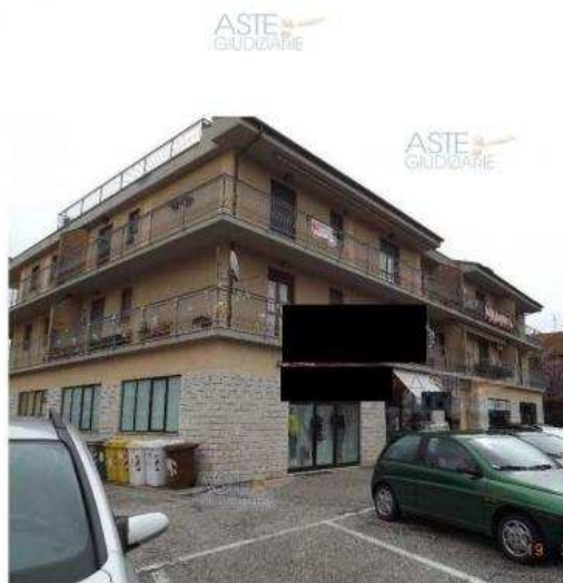
www.astegjudiziarie.it Fronte principale del fabbricato in via Crocefisso n. 20 * Pubblicazione unica ad esclusivo uso personale - è valida ogni republicazione o riproduzione a scopo commerciale - Aut. Min. Giustizia PGG 21/07/06

Luogo Marche, Sassoferrato https://www.annunci.it/x-241437-z