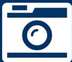
IMMAGINE NON DISPONIBILE

Vendita all'asta Senza incanto, con gara telematica asincrona - LOTTO 27: Appartamento al piano terra, composto da 3,5 vani con annessa corte scoperta. Prezzo base € 47.941,87 (offerta minima € 35.956,40). Data inizio operazioni di vendita: 24/10/2023 ore 10:30. In caso di più offerte valide si procederà a gara che terminerà il 31/10/2023 ore 12:00, salvo eventuali prolungamenti.