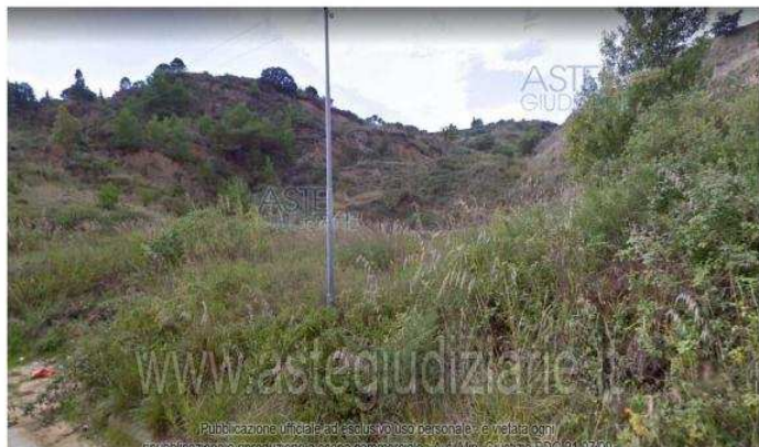
Publicazione ufficiale del Tribunale di Trapani - Sezione Esecuzione Immobiliare In pubblicazione on line sul portale del Tribunale di Trapani - Sezione Esecuzione Immobiliare Foto n. 1 - Vista del lotto dalla SP 12

L'assistenza alla partecipazione all'asta è inoltre possibile contattando il Tribunale della vendita o il professionista incaricato per la vendita, dalle ore 9:00 alle ore 13:00 e dalle ore 14:00 alle ore 18:00, al numero telefonico 0581. Chiudi