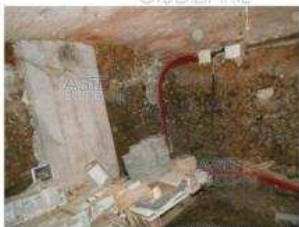
Foto n. 1 - cantina piano interrato

Lotti 33 - 34 e 35 - Meschino piano interrato Via Abbi Pazienza cm.12, lotto 304 nuovo 282 n.33 - 34 e 35