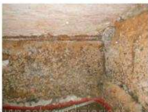
Foto n. 2 - cantina piano interrato

Publicazione ufficiale ad esclusivo uso personale - è vietata ogni riproduzione o riproduzione a scopo commerciale - Art. 17, Quarta P.O. 21/07/03