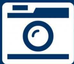
IMMAGINE NON DISPONIBILE