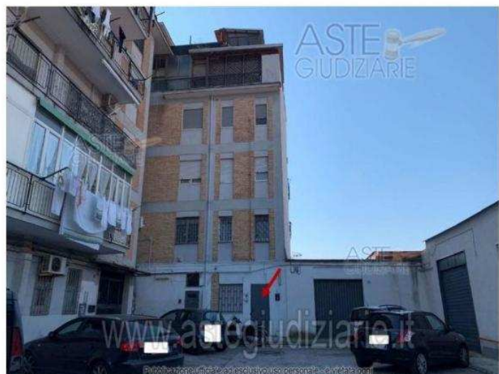
Foto 1 - Vista del fronte del fabbricato da cui trae accesso il locale terraneo stagionato sito in Traversa via Pisciarelli - Pozzuoli (Na)

all'asta. I professionisti incaricati dal Tribunale (custode, delegato, curatore) sono a disposizione per fornire tutte le informazioni necessarie all'acquirente.