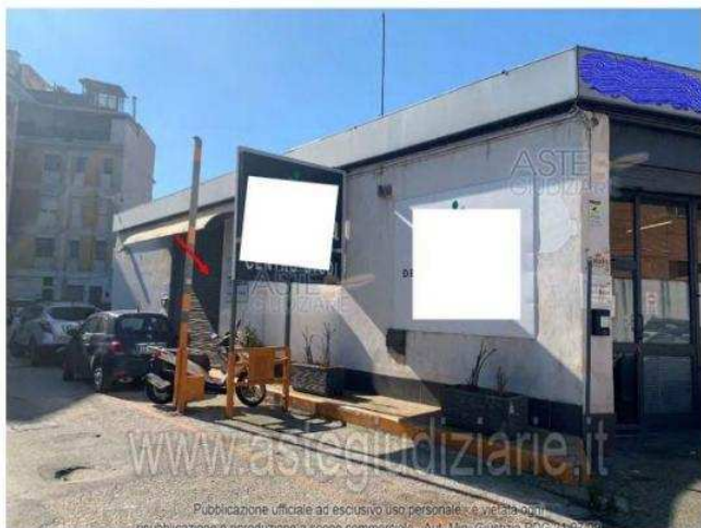
Foto 5 - Vista dell'ingresso al locale p.la 75, sub 7 e annessa porzione del sub 6 (l. trav. Pisciarelli n. 2C)

Luogo Campania, Pozzuoli https://www.annunci.it/x-252631-z