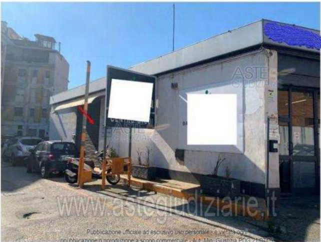
Foto 5 – Vista dell'ingresso al locale p.la 75, sub 7 e annessa porzione del sub 6 (l. trav. Pisciarelli n. 2C)

Luogo Campania, Pozzuoli https://www.annunci.it/x-252631-z