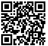
Foto in privato su signal o WhatsApp Chiudi

Jack Russell x Pinscher (due maschietti liberi)