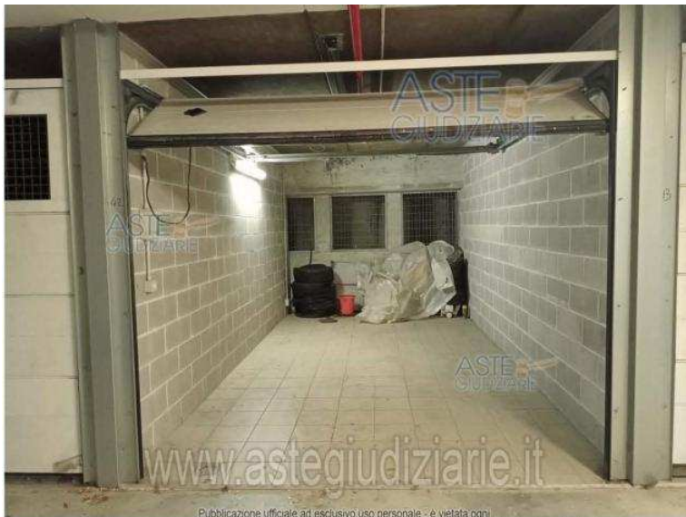
IMMOBILE N.59: SUB.55 (BOX-GARAGE N.42 P.52)

Luogo Abruzzo, Atessa https://www.annunci.it/x-260444-z