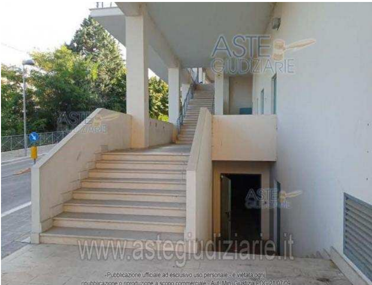
VISTA DALL'ESTERNO ACCESSI AI SUBB.20-21-22

Luogo Abruzzo, Atessa https://www.annunci.it/x-263486-z