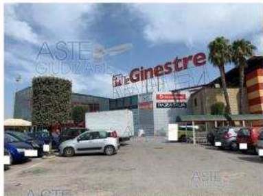
Foto 1 - Vista del complesso immobiliare denominato "CENTRO COMMERCIALE LE GINESTRE" in viale Michelangelo - Volla (NA)