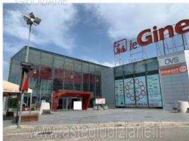
Foto 2 - Vista di un'ala del complesso immobiliare denominato "CENTRO COMMERCIALE LE GINESTRE" in viale Michelangelo - Volla (NA) riproduzione o ripubblicazione a scopo commerciale - Aut. Min. Giustizia P.O. 21/07/03

Luogo Campania, Volla https://www.annunci.it/x-281671-z