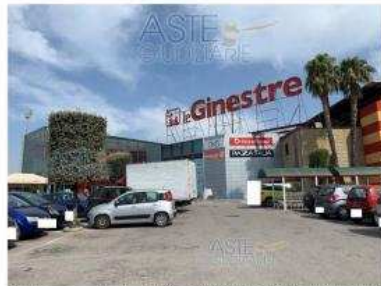
Foto 1 - Vista del complesso immobiliare denominato "CENTRO COMMERCIALE LE GINESTRE" in viale Michelangelo - Volla (NA)