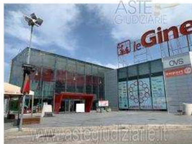
Foto 2 - Vista di un edificio appartenente al complesso immobiliare denominato "CENTRO COMMERCIALE LE GINESTRE" in viale Michelangelo - Volla (NA) Riproduzione o riproduzione a scopo commerciale - Aut. Min. Giustizia P.O. 21/07/03

Luogo Campania, Volla https://www.annunci.it/x-281676-z