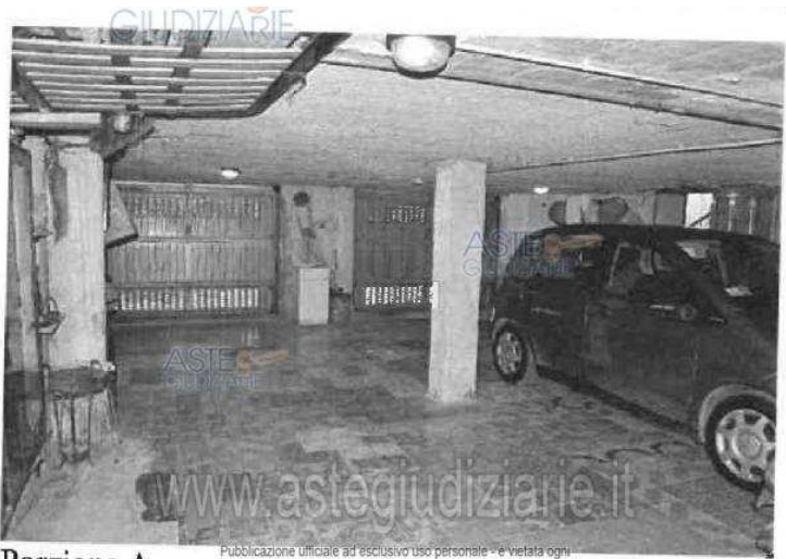
Porzione A Publicazione ufficiale ad esclusivo uso personale - è vietata ogni ripubblicazione o riproduzione a scopo commerciale - Aut. Min. Giustizia PDG 21/07/09

Questo è l'unico annuncio autorizzato dal Tribunale su questo portale. Il Tribunale non ha conferito alcun incarico a intermediari o agenzie immobiliari per la pubblicità giudiziaria e l'assistenza alla partecipazione all'asta. I professionisti incaricati dal Tribunale sono il Custode, l'Esattore, il Giudice e le Commissioni. Il presente annuncio non fornisce tutte le informazioni e tutti i dati necessari per partecipare.