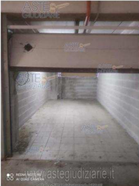
IMMOBILE N.13: SUB.85 (BOX-GARAGE N.18 P.S2)

Luogo Abruzzo, Atessa https://www.annuncici.it/x-288512-z