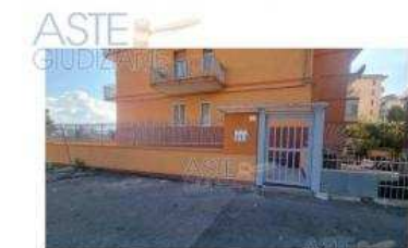
Foto 1 - L'ingresso all'area condominiale