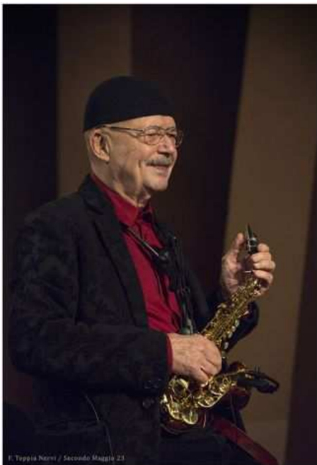
F. Toppia Neri / Secondo Maggio 23

Luogo Lombardia, Milano https://www.annunci.it/x-302599-z