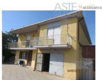
Fabbricato principale - prospetto su Via Valgosina