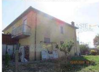
Fabbricato principale - altro prospetto

Pubblicazione offerta al pubblico per personale - in vendita ogni opulazione o riproduzione a scopo commerciale - Aut. Min. Giustizia P.O. 21/07/09