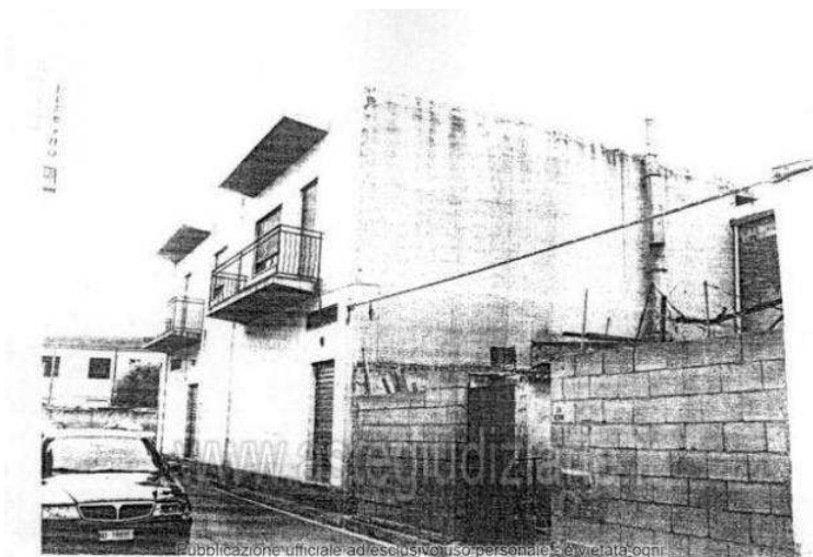
Publicazione ufficiale ad esclusivo uso personale. È vietata ogni ripubblicazione o riproduzione a scopo commerciale - Aut. Min. Giustizia PDG 21/07/09

all'asta. I professionisti incaricati dal Tribunale (custode, delegato, curatore) sono a disposizione per fornire tutte le informazioni necessarie all'acquirente.