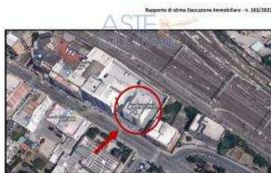
Foto 1. Il municipio condominiale di Viale Della Vittoria 22 - Chivasso (Torino) con i suoi tre gli ascensori paganti