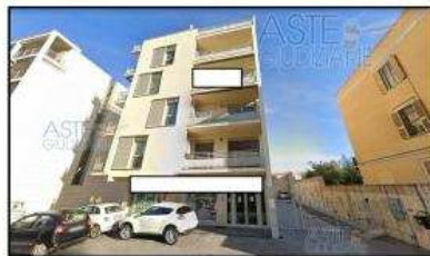
Foto 2. A prospetto principale del fabbricato, lungo Viale della Vittoria.

Pubblicazione ufficiale ad esclusivo uso personale - è vietata ogni ripubblicazione o riproduzione a scopo commerciale - Aut. Min. Giustizia PS/31 21/03/09