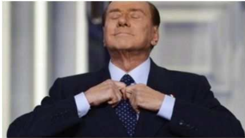
Le cravatte di Berlusconi – collezione privata | LIMITED EDITION

LE CRAVATTE DI BERLUSCONI Collezione privata