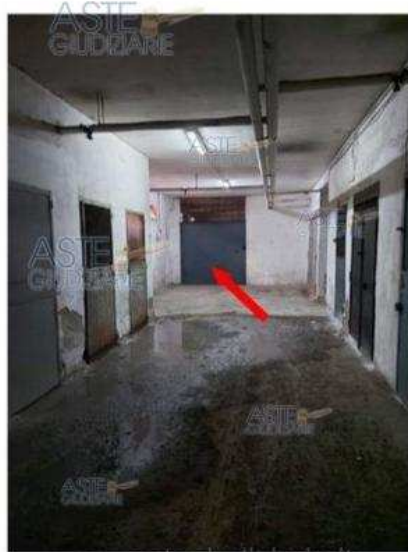
ingresso cespite pignorato Publicazione ufficiale ad esclusivo uso personale - È vietata ogni pubblicazione o riproduzione a scopo commerciale - Aut. Min. Giustizia PGG 210709

Luogo Campania, Portici https://www.annunci.it/x-335386-z