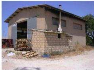
Foto 1) Magazzino per la lavorazione dei prodotti ortofrutticoli.