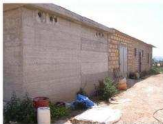
Foto 2) Retro del casotto motore e immagazzini per il deposito carburante e per il deposito dei prodotti fitofarmaci.

Publicazione ufficiale ad esclusivo uso personale - è vietata ogni ripubblicazione o riproduzione a scopo commerciale - Aut. Min. Giustizia POS 2167039