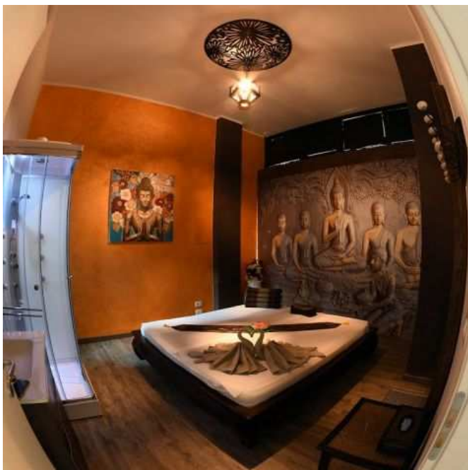
FOTO VERO 100 Thai massage con le ragazze thailandese giovane qualifiche

Luogo Veneto, Verona https://www.annunci.it/x-339598-z