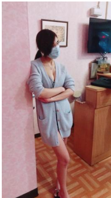
FOTO VERE. RAGAZZE ORIENTALI PER MASSAGGIO INDIMENTICABILE Tel 3533280