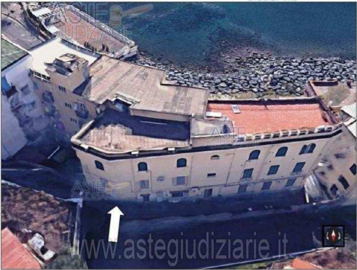
Pubblicazione ufficiale ad esclusivo uso personale - è vietata ogni ripubblicazione o riproduzione senza permesso dell'Aut. Min. Giustizia PDG 21/07/09

Luogo Campania, Pozzuoli https://www.annunci.it/x-343542-z