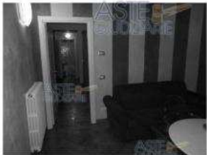
Foto n. 5, soggiorno