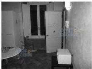
Foto n. 6, soggiorno

www.astegjudiziarie.it Publicazione ufficiale ad esclusivo uso personale - è vietata ogni riproduzione o riproduzione a scopo commerciale - Art. 170, Quarta P.O. 21/07/03