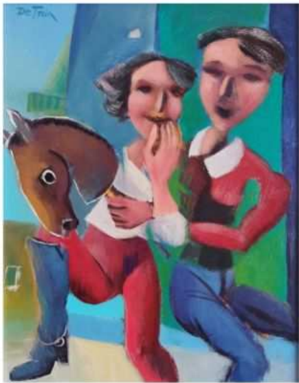
"Lucignolo" 38,5x48,5 cm acrilico su tavola G. De Zola

Luogo Emilia-Romagna, Rimini https://www.annunci.it/x-34825-z Allegorica rappresentazione di lucignolo Tel: 3384501982