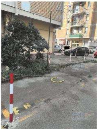
POSTO AUTO ES