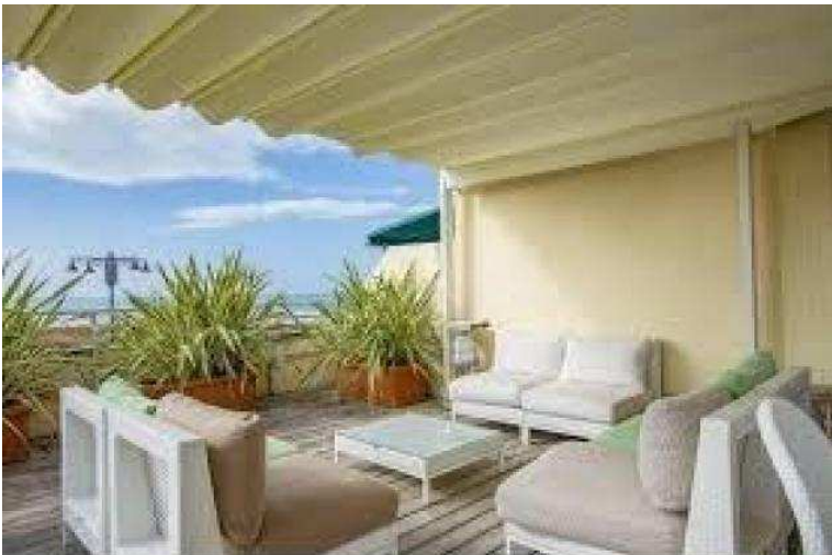
RENDERING -Immagine Dimostrativa

Luogo Toscana, Pietrasanta https://www.annunci.it/x-35059-z