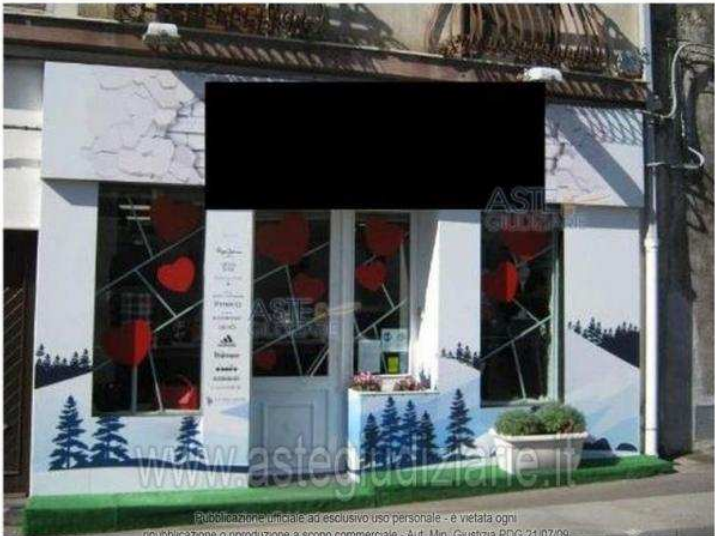
Foto n° 1 - Ingresso dell'immobile oggetto di stima sulla Via Gorizia in Nicolosi (CT). -

Luogo Sicilia, Nicolosi https://www.annunci.it/x-361209-z